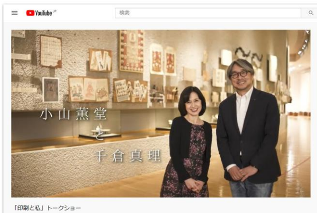
YouTube で配信されているトークショー

「印刷と私」トークショー https://www.youtube.com/watch?v=4qPRsWG8FvM&feature=youtu.be